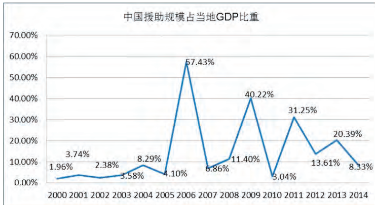
图 2 中国援助规模占当地 GDP 比重 (2000-2014 年)